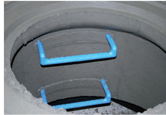
Свежий продукт с смонтированными ступеньками