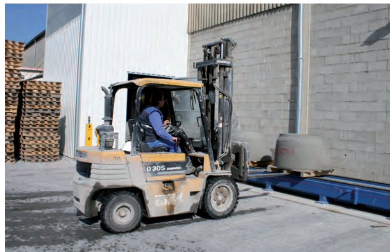
Бетонные изделия отвозятся к месту временного складирования при помощи вилочного автопогрузчика