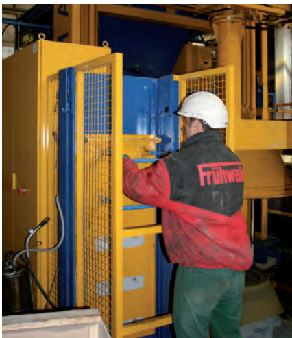
Вставка подъемных элементов в Stepmaster

На фирме Tiba была установлена отдельно стоящая производственная машина, транспортировка продуктов от которой осуществляется вручную, с полностью автоматизированными дополнениями: станциями очистки и смазки поддонов. Следующим шагом к полной автоматизации оборудования может быть установка системы крана-робота Transexact, что возможно благодаря достаточным размерам цеха. Весь процесс производства шахтных компонентов на фирме Tiba обслуживается двумя работниками: один отвечает непосредственно