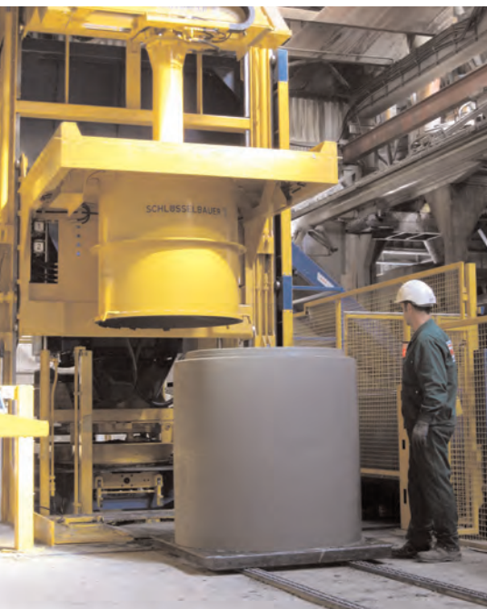
Установка Magic рассчитана на производство изделий внешним диаметром до 1800 мм и высотой до 1500 мм

за процесс изготовления, другой – за обработку изделия после набора им прочности.