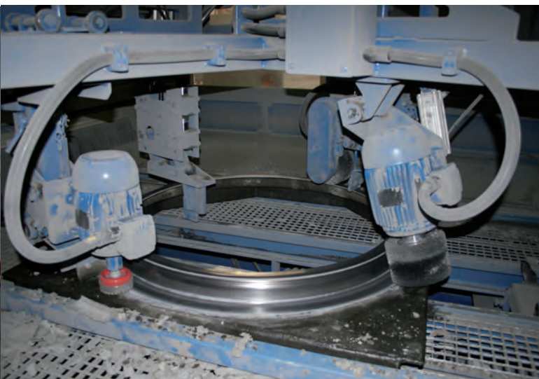
Cleanmaster – полностью автоматизированная очистка поддонов

Дирекция по России, Болгарии, странам Балтии и СНГ Россия, Санкт-Петербург Телефон/факс +7 812 730 60 61 Моб. телефон +7 921 949 90 91 tatiana.egorova@sbm.at