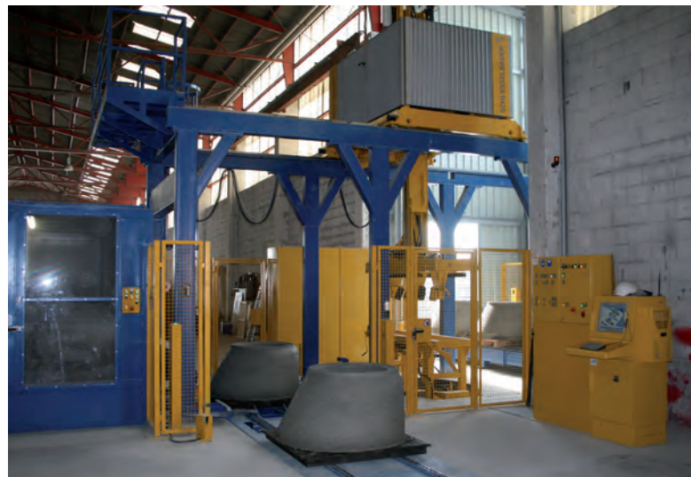
Транспортировка набравших прочность продуктов к станции погрузки с помощью отвозящей тележки