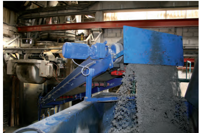
Подача бетона к Magic 1501 осуществляется от смесительных установок фирмы Fruhwald

названные области имеют примерно одинаковое значение. В 80% случаев заказы на такую продукцию поступают от государственных организаций. Главным рынком сбыта является Австрия. Однако и в приграничных государствах, от Словении до Чехии, Tiba занимает значительную часть рынка. Но это еще не предел. Фирма Tiba также получила право