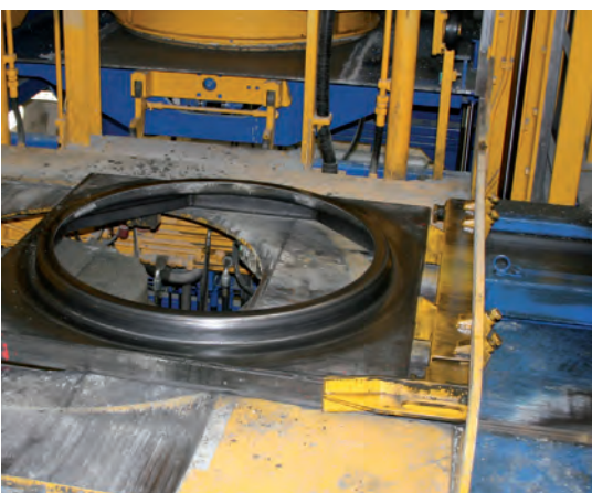
Автоматическая подача поддонов