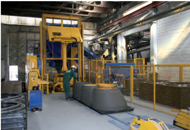
Установка Magic 1501; справа – магазин поддонов перед станцией смазки