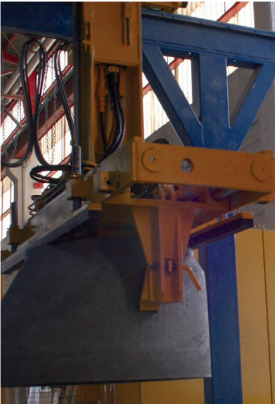
Кран перемещает шахтные компоненты при помощи захвата

накопившиеся изделия в зону набора прочности. Второй рабочий, с помощью другой тележки, отвозит набравшие прочность продукты к посту автоматического освобождения от поддонов и станции палеттирования, тем самым обеспечивая машину очищенными поддонами. Он также обслуживает полностью автоматизированные процессы палеттирования и очистки поддонов, так называемый Cleanmaster, который напрямую связан со станцией палеттирования. При палеттировании набравшие прочность изделия по отдельности подаются на станцию, где