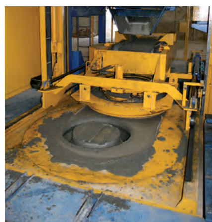
Наполнение и уплотнение